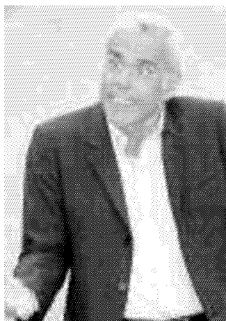
COMICO. Teo Teocoli